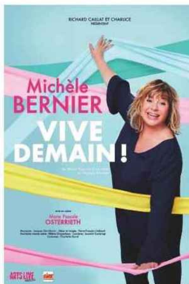
Michèle Bernier au Silo le 14 mars 2020